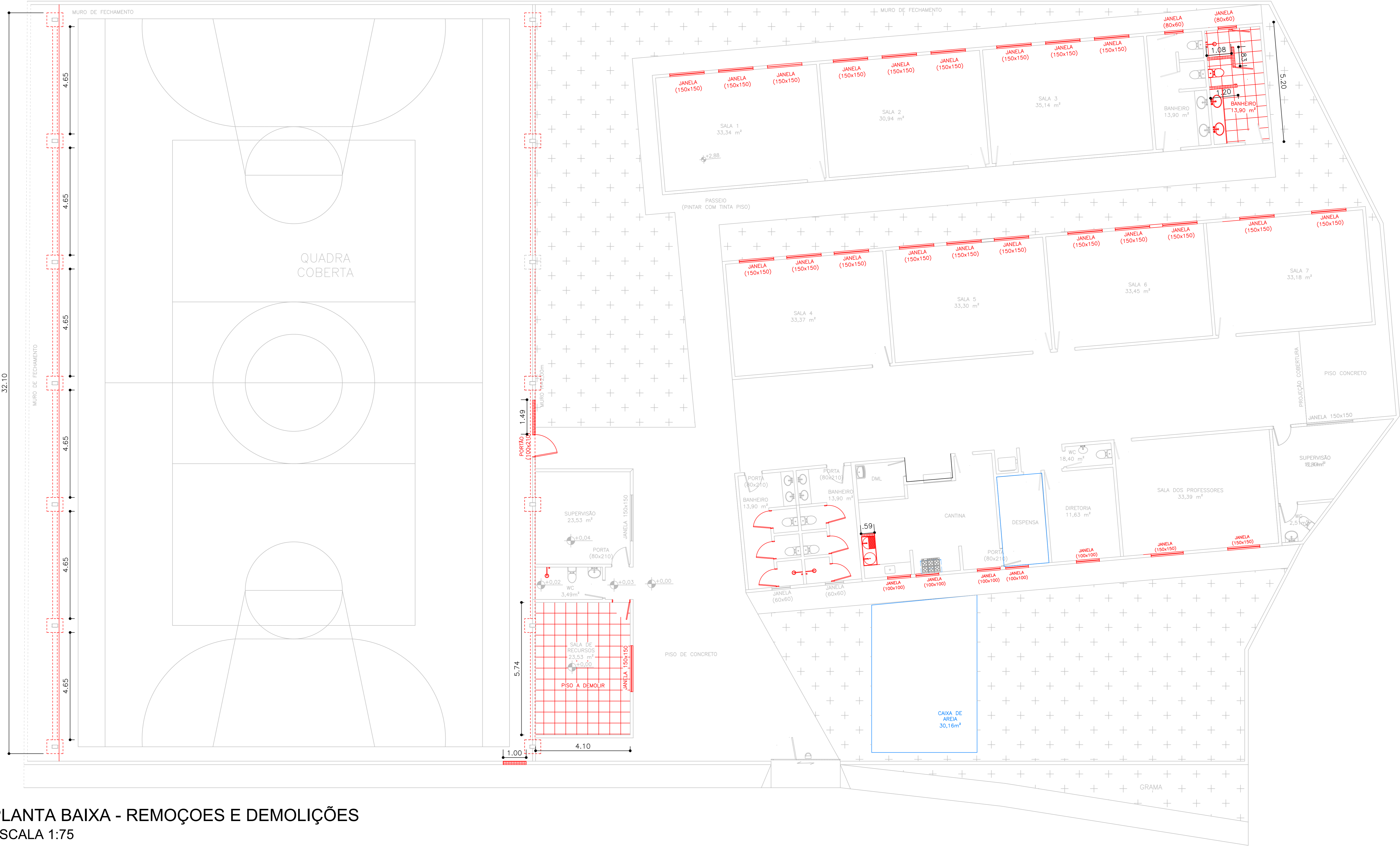
PLANTA BAIXA - REMOÇÕES E DEMOLIÇÕES ESCALA 1:75